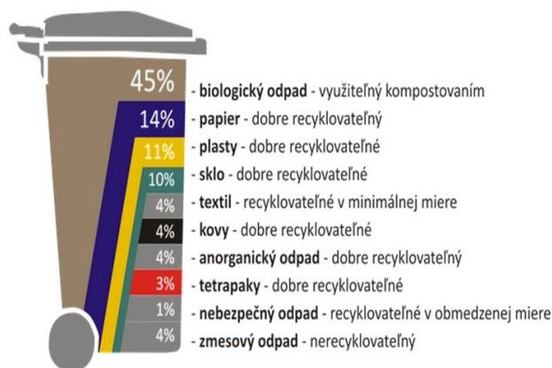
Obrázok č. 1