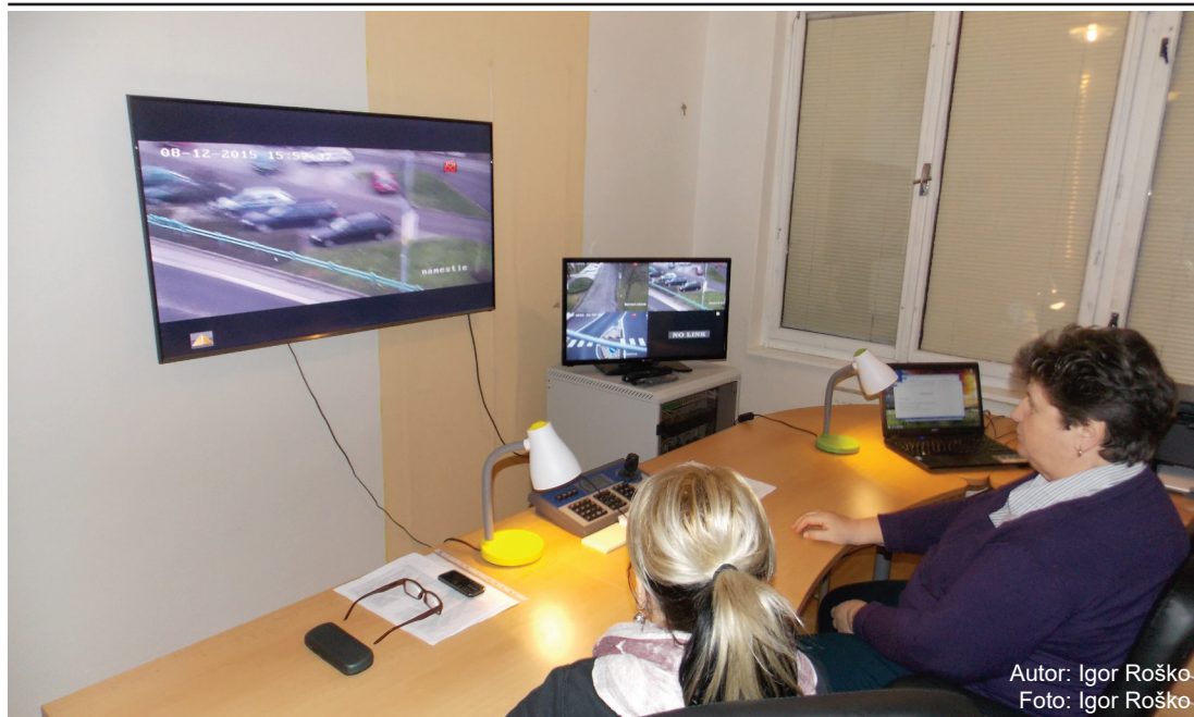
Autor: Igor Roško