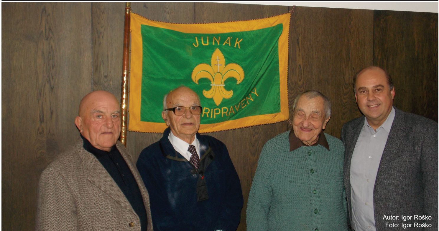
Autor: Igor Roško