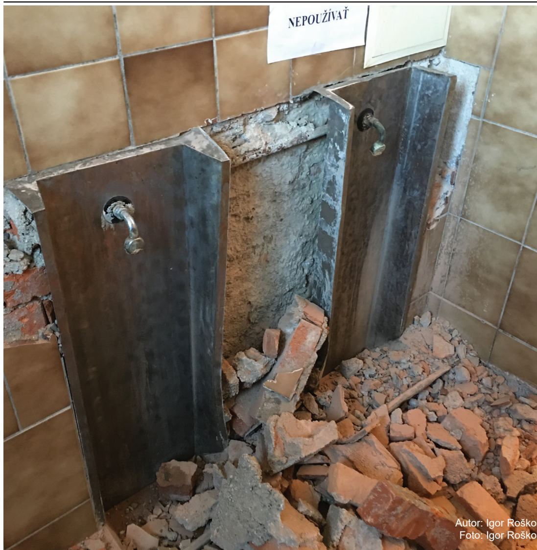
Autor: Igor Roško