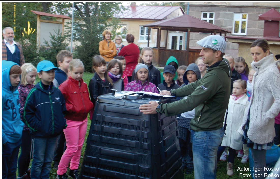
Autor: Igor Roško