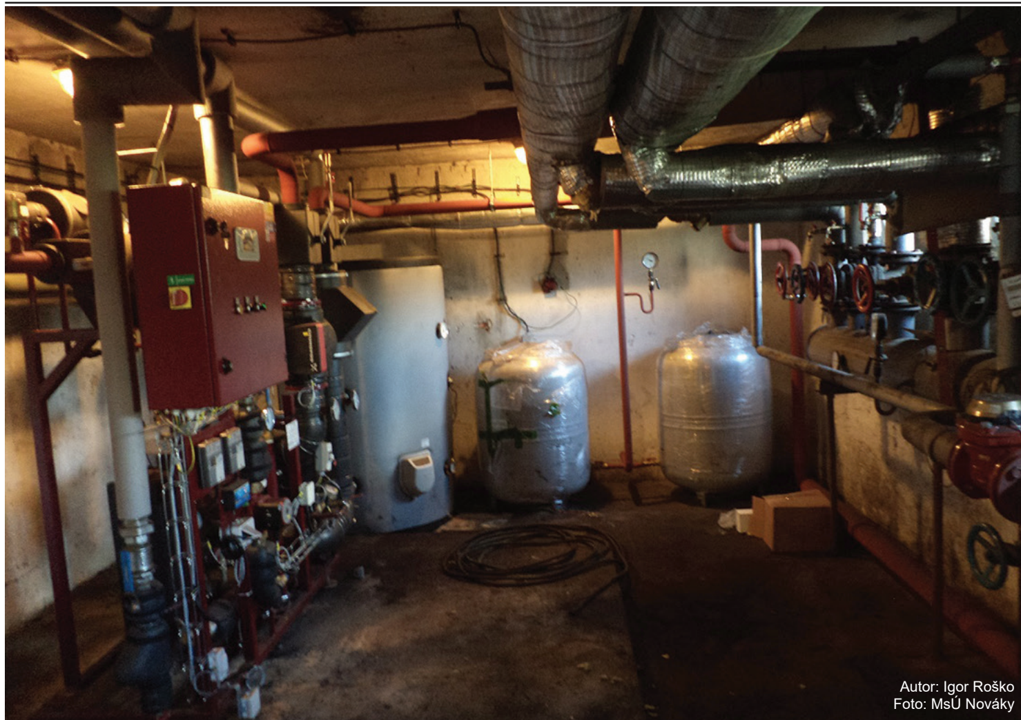
Autor: Igor Roško