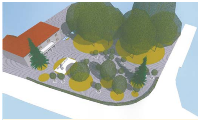
▲ Riešenie spevnených plôch a sadových úprav pri Mestskom úrade Nováky.