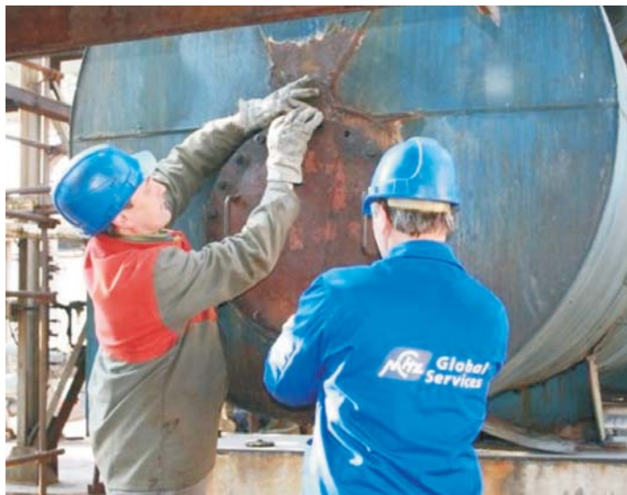
▲ Práce počas celopodnikovej odstávky zabezpečovali zamestnanci fy NCHZ Global Services, a.s.