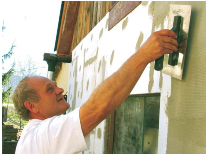
▲ Pri zatepľovaní rodičovského domu

S čerstvým výučním listom ho skutočne prijali na tretí cech. Najskôr robil tie najjednoduchšie, ale aj najnamáhavejšie práce. Obyčajne čistili od katalyzátorov reaktory, kde dochádzalo k polymerizácii PVC. Po roku prišiel povolávací rozkaz. Potešil sa, keď zistil že sa v Jaroměři v Krkonošiach